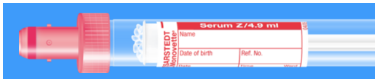
Monovette ISO bouchon ROUGE – N° commande : 998990