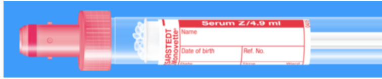
Monovette ISO bouchon ROUGE – N° commande : 998990