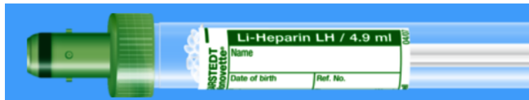
Monovette ISO bouchon VERT - N° commande : 998991