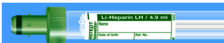
Monovette ISO bouchon VERT – N° commande : 998991