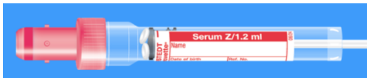
S-Monovette ISO bouchon ROUGE - N° commande : 998994