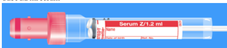
S-Monovette ISO bouchon ROUGE - N° commande : 998994

Contenant(s) autre(s) 4 Microtubes 0.3 ml sérum