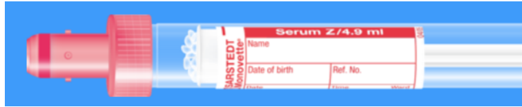
Monovette ISO bouchon ROUGE – N° commande : 998990