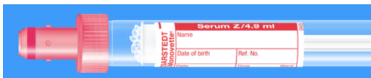
Monovette ISO bouchon ROUGE – N° commande : 998990