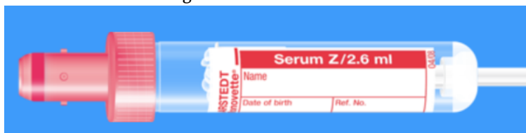
Monovette ISO bouchon ROUGE – N° commande : 999008