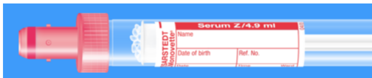
Monovette ISO bouchon ROUGE – N° commande : 998990