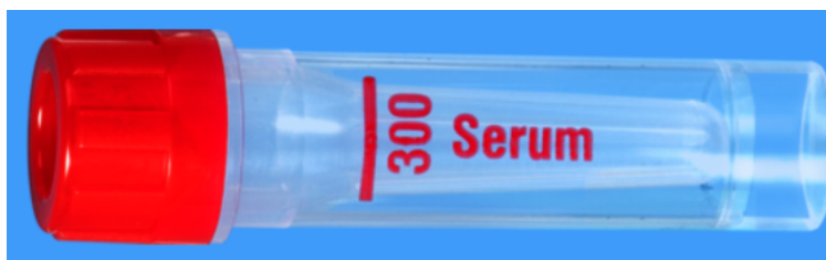
Microvette ISO bouchon ROUGE – N° commande : 999002