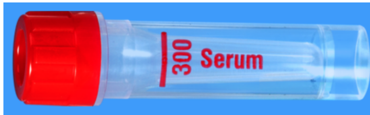
Microvette ISO bouchon ROUGE - N° commande : 999002