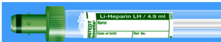
Monovette ISO bouchon VERT – N° commande : 998991

Règle(s) si cumul avec d'autres analyses Jusqu'à 3 analyses sur héparinate de lithium, le même tube suffit