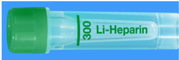
Microvette ISO bouchon VERT - N° commande : 999003