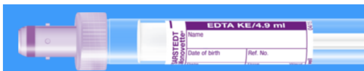
Monovette ISO bouchon VIOLET - N° commande : 999013