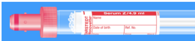
Monovette ISO bouchon ROUGE – N° commande : 998990