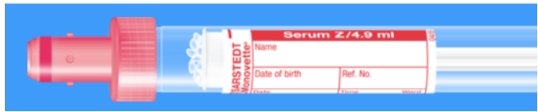
Monovette ISO bouchon ROUGE – N° commande : 998990