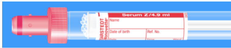
Monovette ISO bouchon ROUGE – N° commande : 998990