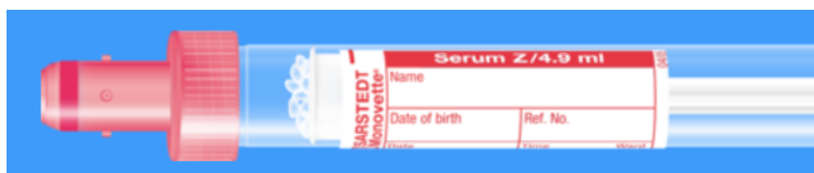
Monovette ISO bouchon ROUGE – N° commande : 998990