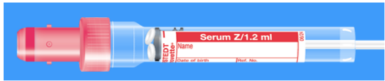
S-Monovette ISO bouchon ROUGE - N° commande : 998994