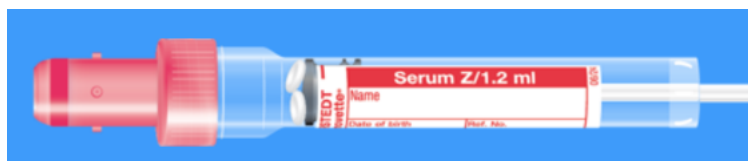
S-Monovette ISO bouchon ROUGE - N° commande : 998994