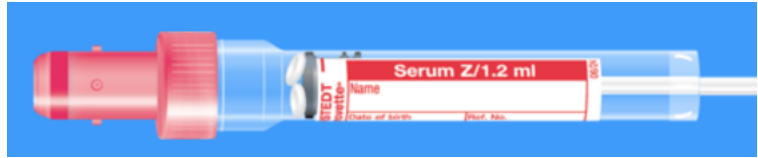
S-Monovette ISO bouchon ROUGE - N° commande : 998994