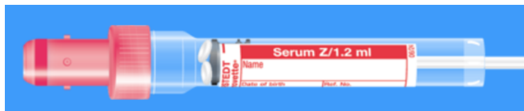
S-Monovette ISO bouchon ROUGE - N° commande : 998994