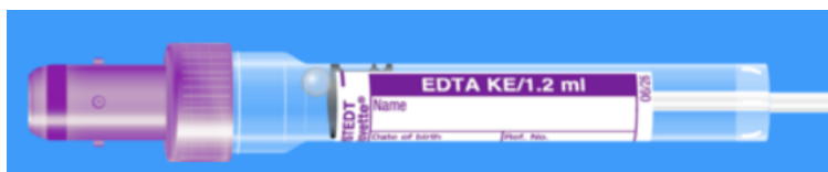
Monovette ISO bouchon VIOLET - N° commande : 998995