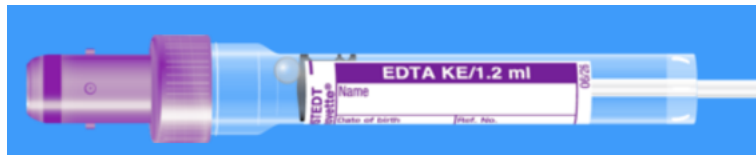
Monovette ISO bouchon VIOLET - N° commande : 998995