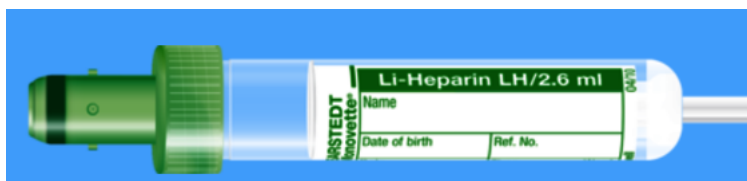
Monovette ISO bouchon VERT – N° commande : 999007