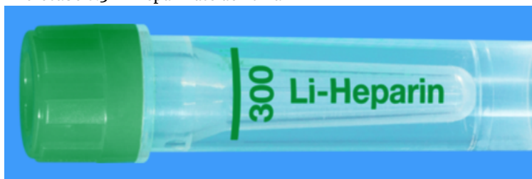
Microvette ISO bouchon VERT – N° commande : 999003