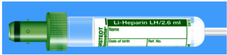
Monovette ISO bouchon VERT - N° commande : 999007