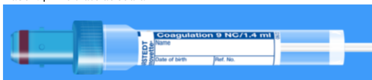
Monovette ISO bouchon BLEU - N° commande : 998998