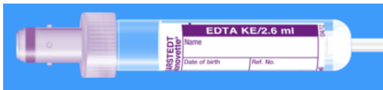
Monovette ISO bouchon VIOLET - N° commande : 999009