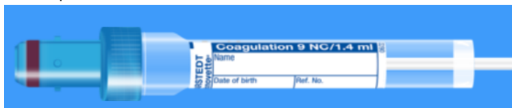
Monovette ISO bouchon BLEU - N° commande : 998998