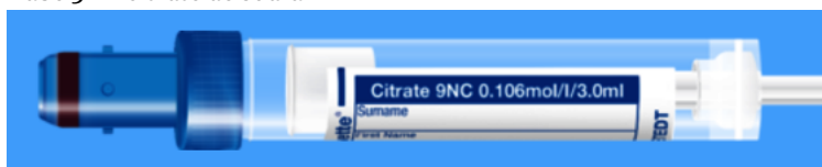
Monovette ISO bouchon BLEU - N° commande : 998993