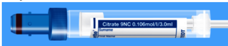
Monovette ISO bouchon BLEU – N° commande : 998993