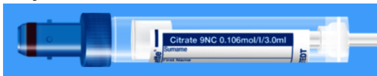
Monovette ISO bouchon BLEU - N° commande : 998993