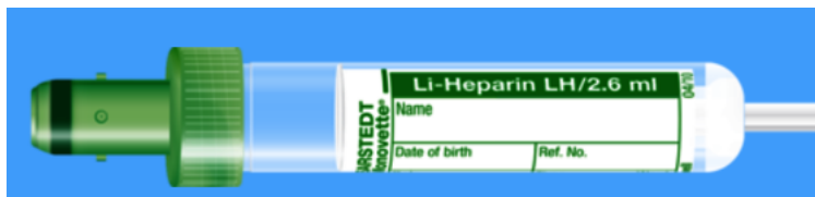
Monovette ISO bouchon VERT – N° commande : 999007